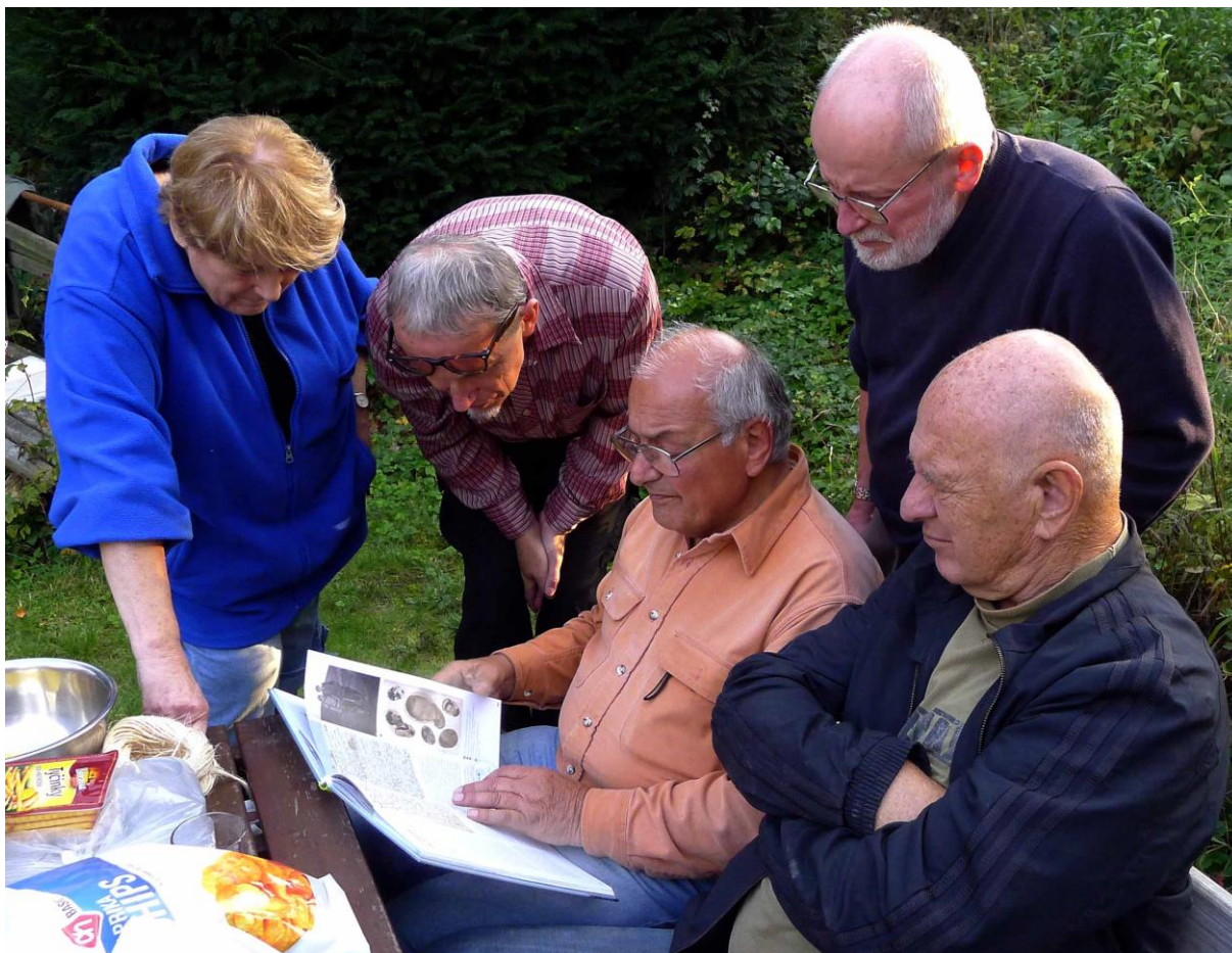
Prohlíželi jsme si knížku Skautský oddíl, kterou vytvořil a dotáhl do úspěšného vydání Bobo .