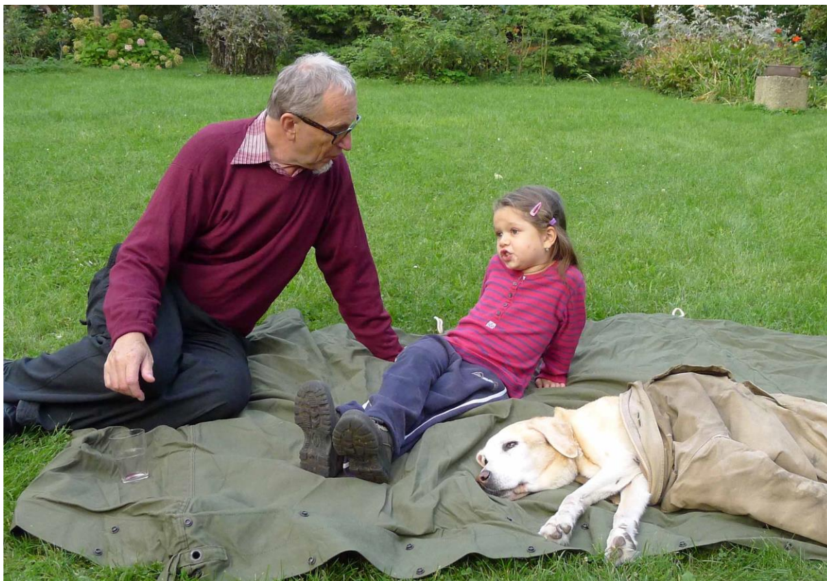
Job si nejlépe rozuměl s dětmi a psy.