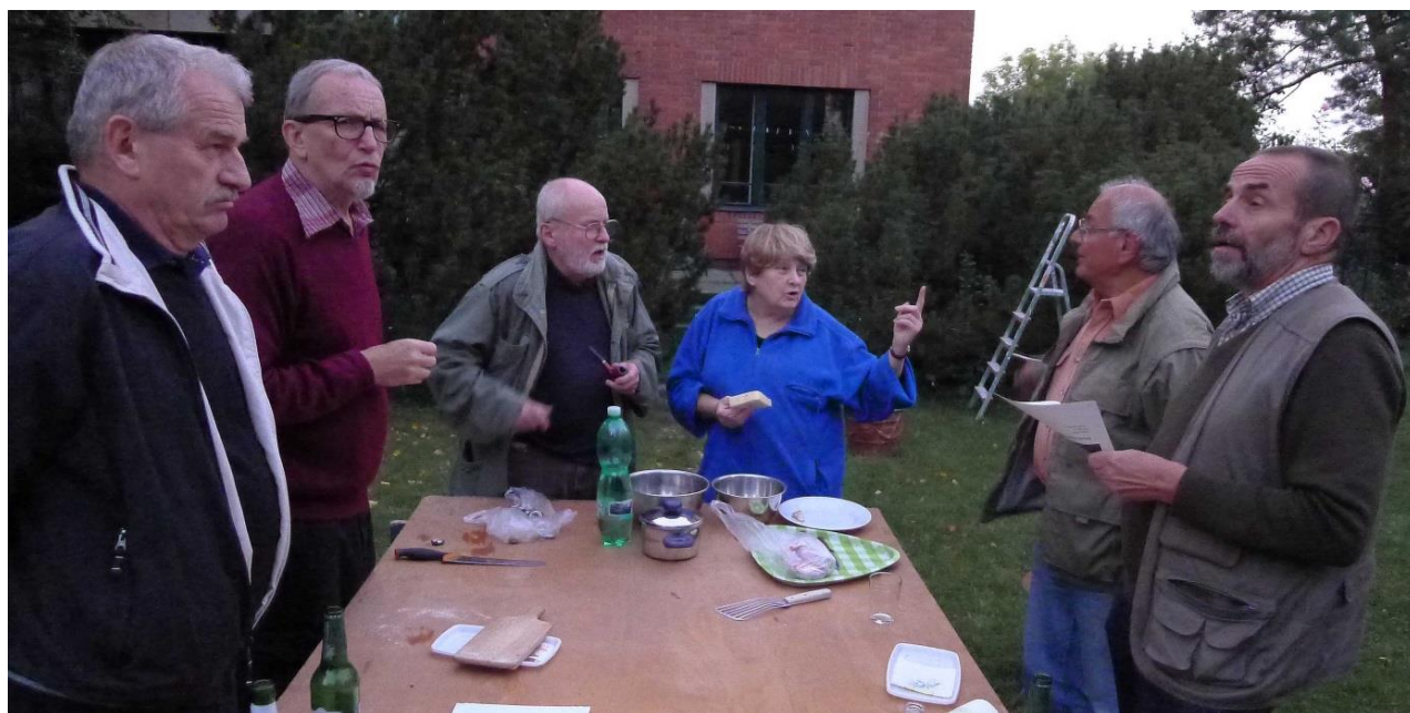
Autorita Bjanky byla nezpochybnitelná.