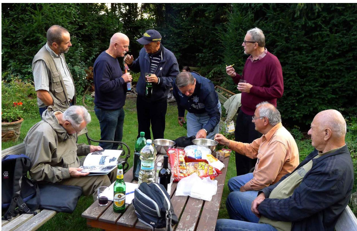
Dokonce někteří dali přednost knížce před obžerstvím.