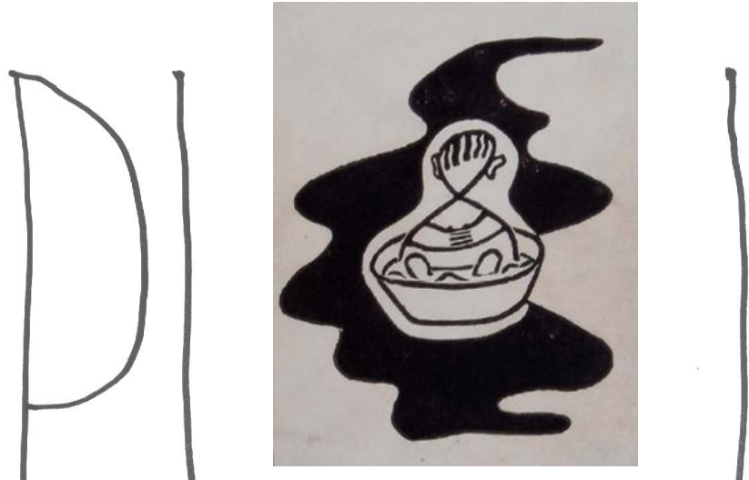
Reyp pod vlajkou Pětky letos na Jadranu