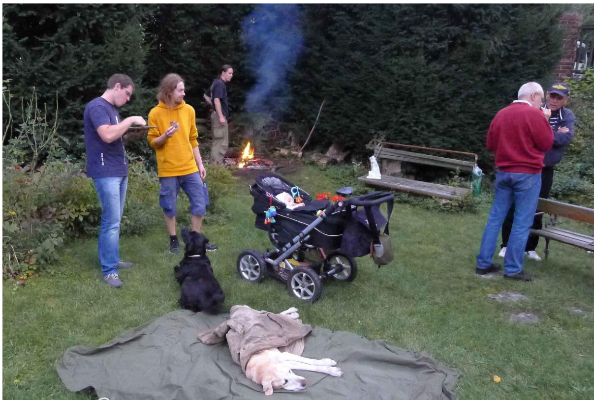
Zkrátka, byla to idyla.